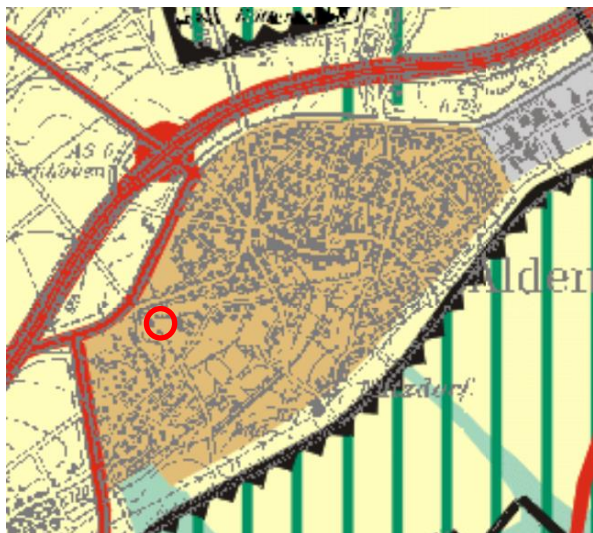
Abbildung 2 Ausschnitt aus dem Regionalplan Köln, Teilabschnitt Region Aachen (Quelle: Bezirksregierung Köln 2003).