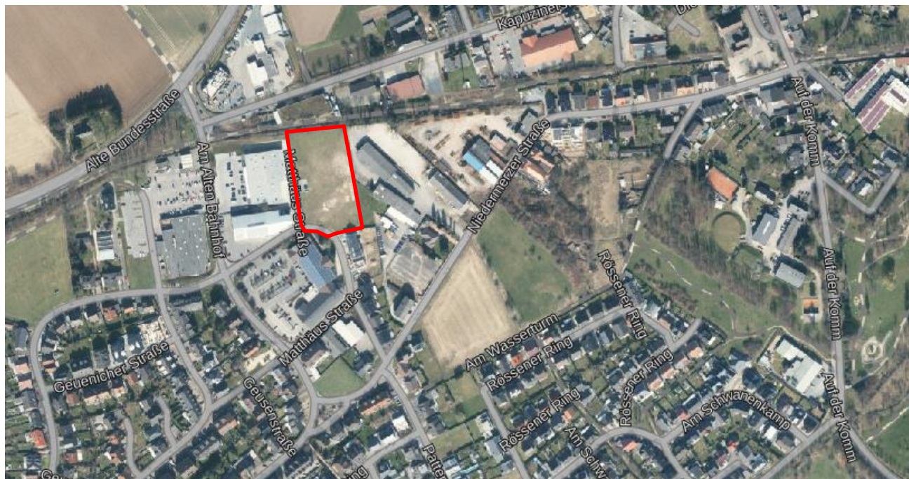
Abbildung 1 Luftbild des Plangebietes (eigene Darstellung nach Land NRW (2019)).

und eine Netto Filiale. Im Westen befinden sich die bereits genannten Einzelhandelsniederlassungen von Action und Takko Fashion sowie ein Drogeriemarkt, ein Schuhcenter und ein KIK-Textildiscounter. Auf der gegenüberliegenden Straßenseite sind zudem ein Edeka-Markt, ein Autoteilhandel und eine Tankstelle zu finden. Nördlich des Plangebietes befindet sich Wohnnutzung, Gastronomie (Restaurant Palme, McDonald's Restaurant), eine Shell Tankstelle und ein Autohändler. Im Osten des Plangebietes befinden sich Wohnnutzungen sowie im Weiteren die Lagerflächen und Betriebsgebäude eines Eisengroßhandels.