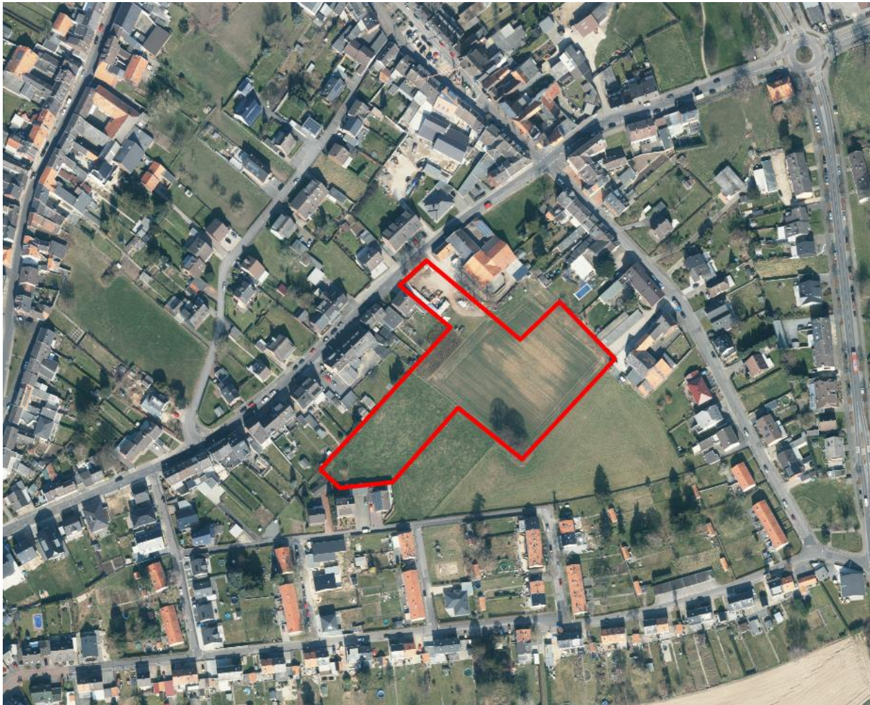
Abbildung 1 Luftbild des Plangebietes (eigene Darstellung nach Land NRW (2018))

Die Umgebung des Plangebietes stellt sich als ein dörfliches Wohngebiet dar. Entlang der umgebenden Straßen Pützgracht, Schleidener Straße und am Steinacker befinden sich vorwiegend Wohnhäuser, die das Plangebiet rahmen.