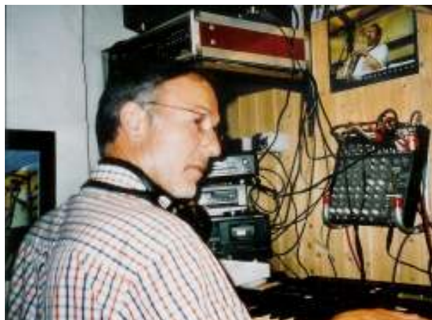
Herr Derwall sorgte für die musikalische Begleitung